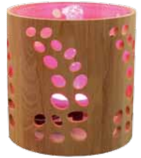
réf: RB10 D: d:17,5 x h19 cm