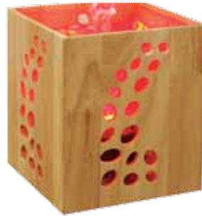
réf: CB10 D: 15x15xh18,5 cm