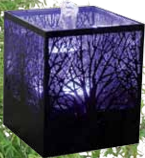
réf: CM20 D: 15x15xh18,5 cm