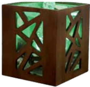
réf: CB20 D: 15x15xh18,5 cm