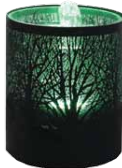
réf: RM20 D: d:17,5 x h19 cm