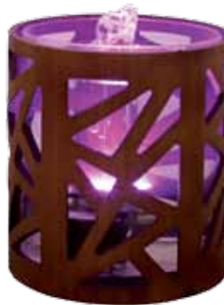
réf: RB20 D: d:17,5 x h19 cm