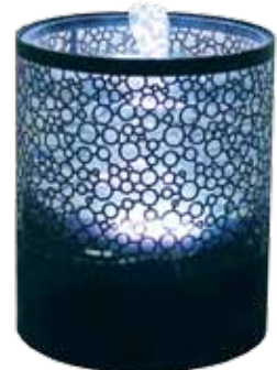
réf: RM10 D: d:17,5 x h19 cm