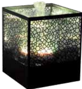
réf: CM10 D: 15x15xh18,5 cm